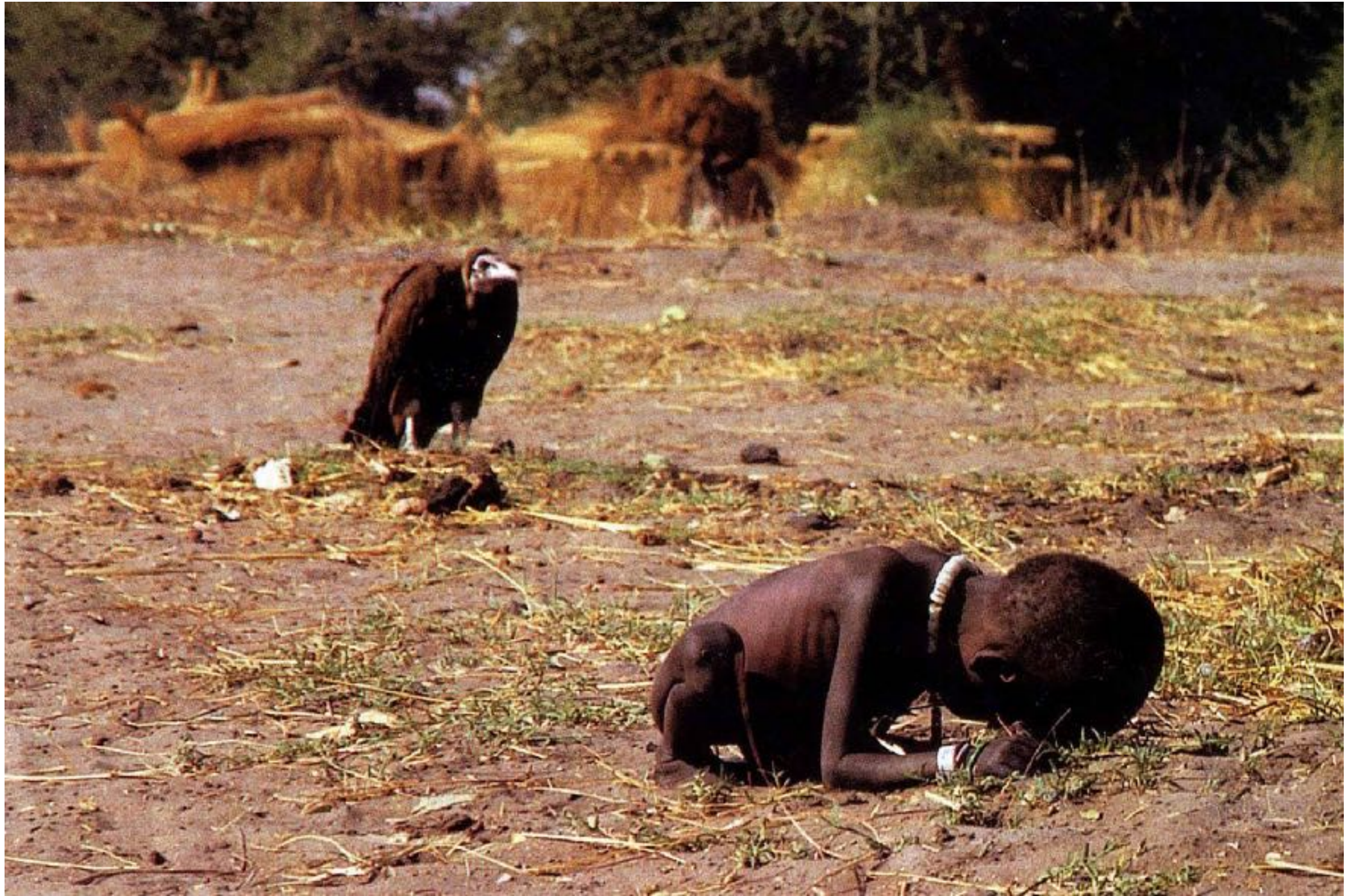
Kevin Carter, 1994